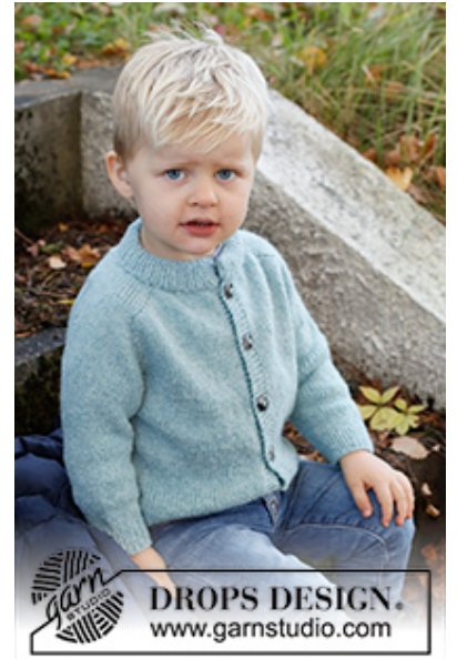
DROPS Children 40-13

Garnforbrug ved alternativt garn – Brug vores garn-omregner her