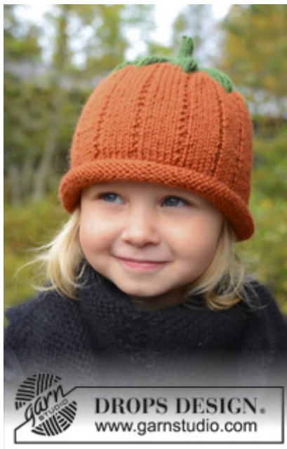
DROPS Extra 0-966

DROPS STRØMPEP OG RUNDP (40 cm) nr 3,5 – eller den p du skal bruge for at få 22 m x 30 p på 10 x 10 cm.