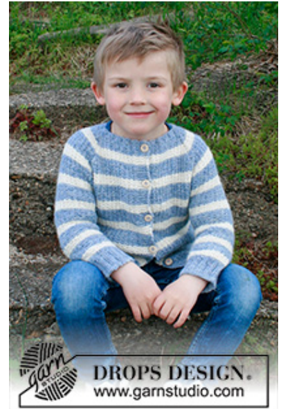
DROPS Children 34-20

Garnforbrug ved alternativt garn – Brug vores garn-omregner her