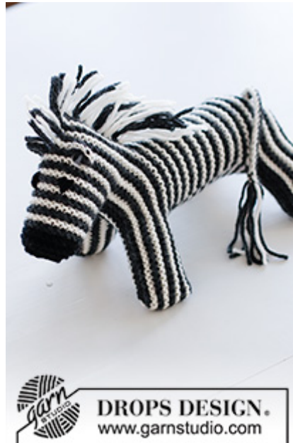
DROPS Children 37-19

Garnforbrug ved alternativt garn – Brug vores garnomregner her