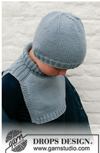
DROPS Children 41-26

Teknikken MAGIC LOOP kan bruges – da behøver man kun en rundpind på 80 cm i hvert pinde-nr.