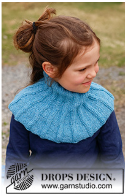
DROPS Children 44-6

Garnforbrug ved alternativt garn – Brug vores garn-omregner her -----