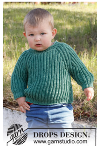
DROPS Baby 38-7

Garnforbrug ved alternativt garn – Brug vores garn-omregner her