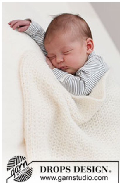
DROPS Baby 39-3

Garnforbrug ved alternativt garn – Brug vores garn-omregner her