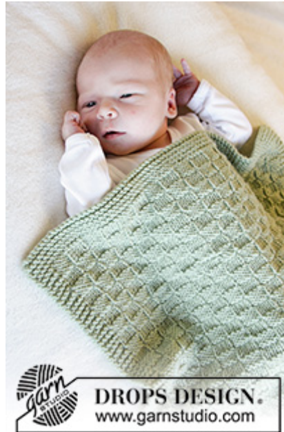
DROPS Baby 33-39

Garnforbrug ved alternativt garn – Brug vores garn-omregner her